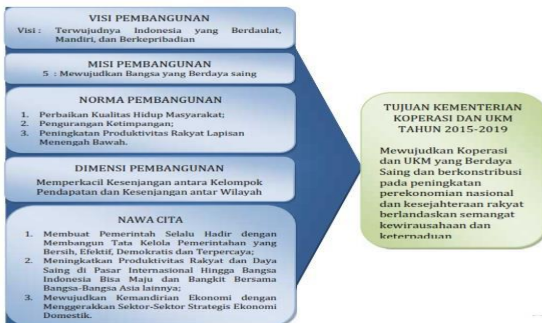
Gambar 1 Penjabaran Visi dan Misi Kabinet Kerja